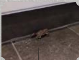
14. maj: Kys Frøen! - eneste deltager til orienteringsmødet om menighedsråds- valget...