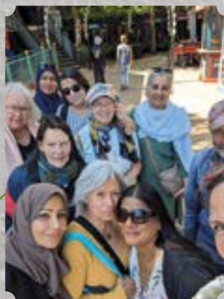
17. maj: Aktiv Fredags Tivolitur