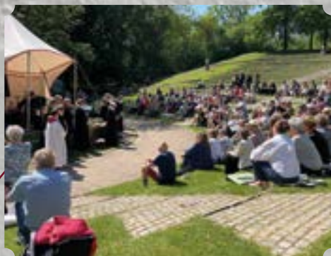
2. Pinsedag: Fælles provstigidstjeneste på Bellahøj Friluftsscene